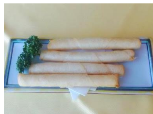
チーズスティック揚げ 690