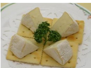
カマンベールチーズ 1,100