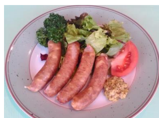
粗挽きポークウインナー 780