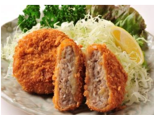
■アゲ豚メンチカツ 920