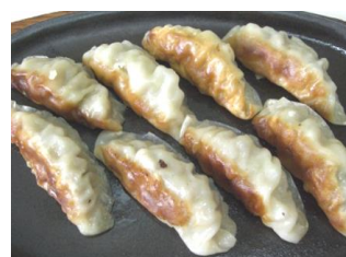
鉄板焼 餃子 890