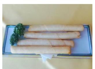
チーズスティック揚げ 690