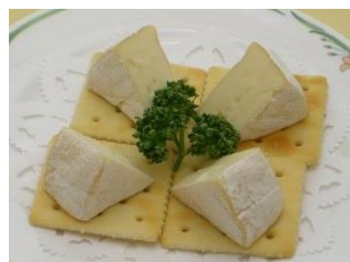
カマンベールチーズ 1,100