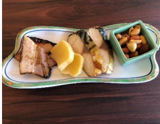
自家製スモーク盛り合せ 890