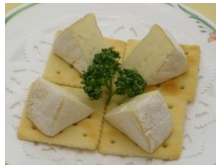
カマンベールチーズ 1,100