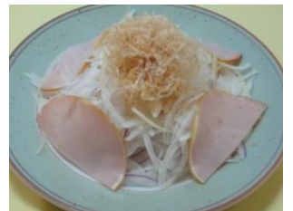
オニオンスライス 770