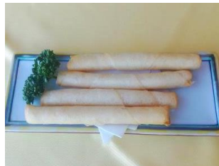
チーズ入りスティック揚げ 880